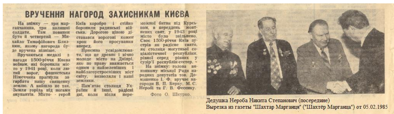
Вырезка из газеты «Шахтар Марганця» от 05.02.1985 г. Вручение юбилейных медалей защитникам Киева в честь 1500 летия Киева. Мой прадедущка – посередине

Таким я знаю моего прадедущку по рассказам бабушки и мамы. Мы помним о нем.